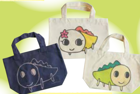
ミニトートバッグ