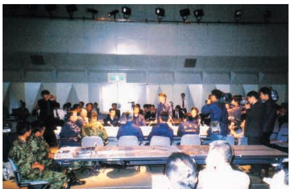
平成15年10月30日・31日の2日間、鳥取県で「第1回国民保護フォーラム」が開催された。写真は、県・町の幹部や自衛隊が参加して行われた国民保護対策本部の展示訓練の様子

武力攻撃事態等が迫った場合は、まず国が情報を収集・分析して、対策本部長が国民に警報を発令し、