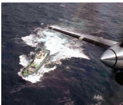
九州南西沖に現れた武装不審船(平成13年12月)

急事態に対処することができるように必要な備えをしておくことは、独立国家としての当然の責務です。武力攻撃事態に対処するための態勢整備は、外部からの武力攻撃という国家にとって最も重大な事態