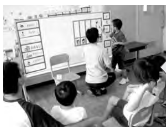
「日常生活の指導」の様子 朝の会で予定の確認をします