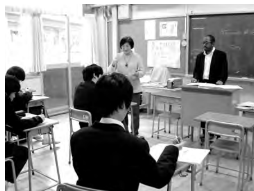
特別支援学級での英語の授業