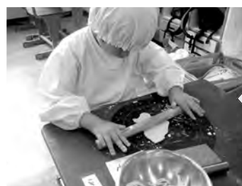
「生活単元学習」 の中の調理活動の様子