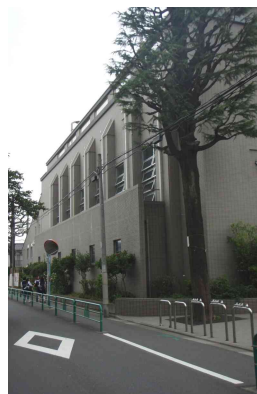
プール・体育館棟の外観