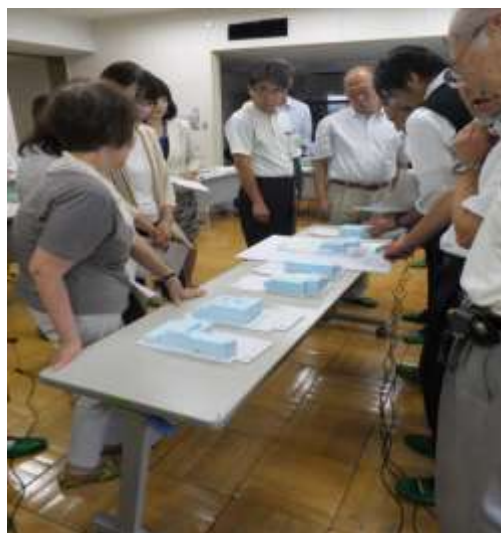
様々な案の模型を見て検討

また、校庭の仕様も含め、今後も近隣に対する影響に配慮しながら設計の検討を進めていきます。