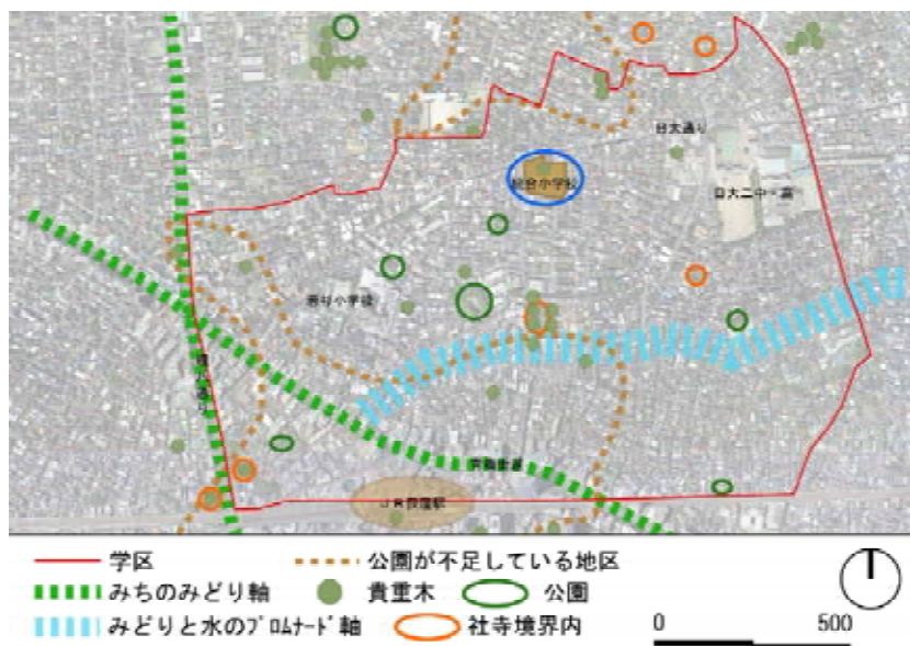
2-2. みどりと水のネットワーク図 (杉並区みどりの基本計画より)