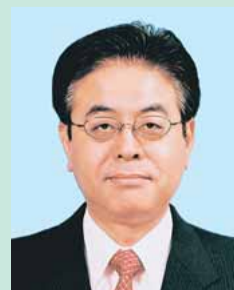
杉並区議会副議長 島田敏光