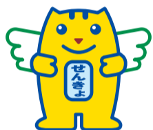
▲イメージキャラクター 「選挙のめいすい(明推)くん」

目の不自由な方や、手が不自由などの理由で自書することが困難な場合は、「点字投票」や、係員による「代理投票」ができます。投票所で係員にお申し出ください。