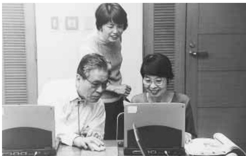
隣り同士で助け合って(成田図書館)

4月から始まったIT講習会は、現在第3期の講座を開催中で、これまで多くの方が受講しました。区は、第4期として、14年1月～2月に開催する講習会の受講者約2400人を募集します。この講習は、パソコンの初心者、インターネットによる情報の収集や、電子メールによる情報の送受信など、情報通信技術(IT)に関する基礎技能を修得することを目指しています。