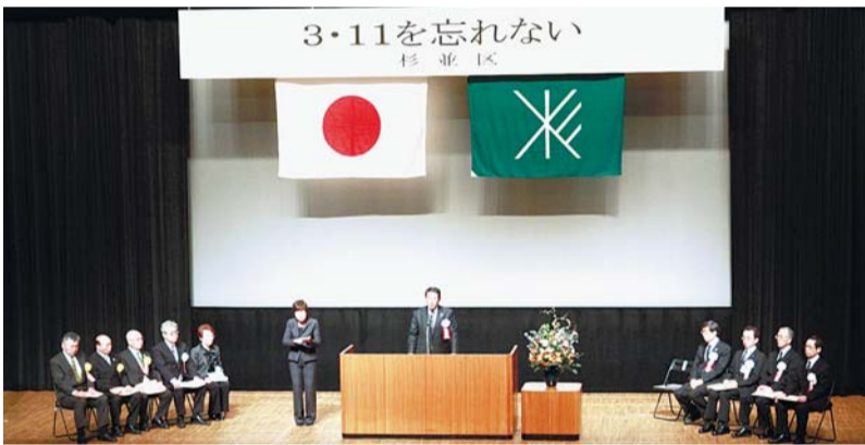
▶ 昨年の式典の様子

東日本大震災から3年目を迎えるにあたり、いつ起こるかわからない新たな災害に備えるため、次の式典を行います。 ——問い合わせは、危機管理対策課へ。