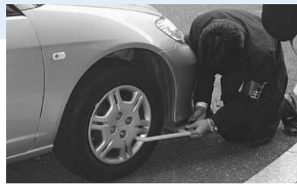
▲タイヤロックの様子