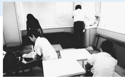
▲搜索の様子

行政サービスの原資となる「税金」や「保険料」等は、所得や受益に応じて区民の皆さんに平等にご負担いただくものです。しかし、滞納者による未収金(収入未済)も増加傾向にあり、大きな課題となっています。