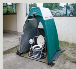
マンホールトイレ