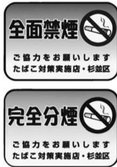
「喫煙対策実施施設」新規登録店