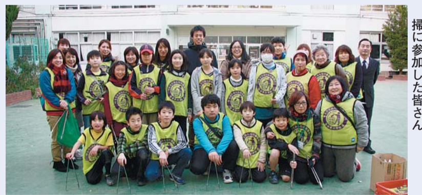
井荻小学校6年生と善福寺川清掃に参加した皆さん

のかをノートに記録します。紙くずやお菓子の包み紙のほか、特に多いごみは、たばこの吸い殻です。子どもたちは「たばこの吸い殻は大人が出すごみです。ポイ捨てをやめてほしい。」と話していました。