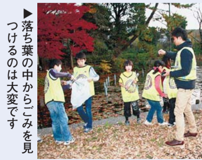
落ち葉の中からはごみが見つかる

町会の方などたくさんの方が集まり、その活動は年々広がっています。トングを片手に学校から出発。歩きながらごみを拾っていきます。子どもたちは、われ先にとごみを探します。特にごみが多い場所はベンチや遊具の周りです。落ち葉に埋もれたごみを上手に見つけ出し、手際よく分別しながら、何が落ちていた