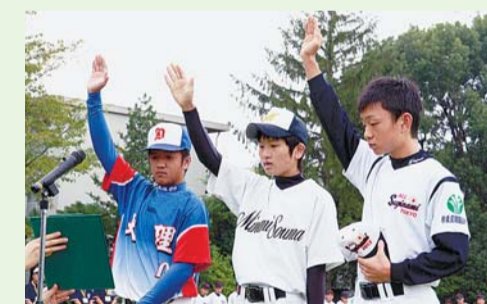
各地域の代表が選手宣誓を行いました

セレクションに集まった中学生球児は70名ほど、その中から選ばれた40名で選抜チームを編成しました。日頃は、別々のチームで競い合う者が、一つの目標に向けて、協力し高めあっていく姿は、とてもすばらしいものでした。選手全員が、この大会に参加できたことの喜びを忘れずに、この経験を人生の宝物としてくれることを信じています。