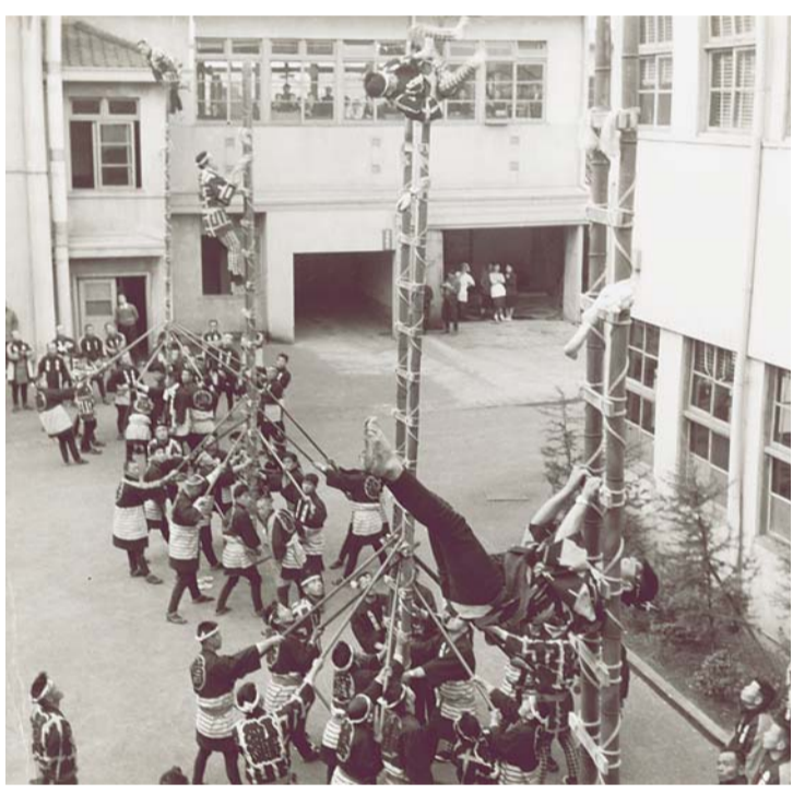
▲災害のない一年を願って… 区役所前の出初式 (昭和34年1月)