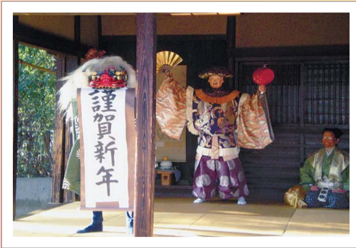
▲良い一年となりますように… (大宮前囃子) 大宮前囃子は宮前周辺に伝わる民俗芸能で、区の登録無形民俗文化財です。大宮前郷土芸能保存会の皆さんが郷土博物館古民家で舞を披露します。詳細は、4面をご覧ください