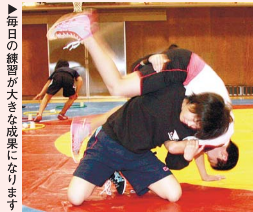
毎日の練習が大きな成果になります