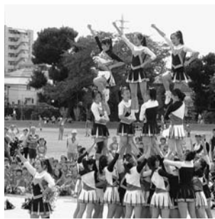
▲地元高校生によるチアリーディング演技

堀ノ内松ノ木地区町会・自治会連絡協議会は、「旧みずほ銀行済美山運動場跡地」の活用について、長年東京都に對し、単に競技場の新設だけではなく、災害時には避難場所として機能する運動広場として改修整備するように強く要望してまいりました。 その結果、400メートルトラックなどを区内で初めて完備し、災害時は避難場所として機能する都立済美山運動広場(堀ノ内1丁目)が完成しました。