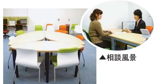
▲若者就労支援コーナー

若者の失業の長期化や求人倍率の低下など、若者の就労状況が厳しい中、区では就職をバックアップするため、産業商工会館2階に若者の就労準備相談を行う若者就労支援コーナー(愛称「すぎJOB」)とハローワークコーナーが一体となった就労支援センターを開設しました。センターでは、就労準備から職業紹介、就職後の定着支援までの継続的な支援を行っています。