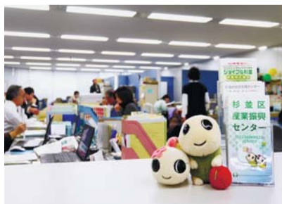
▲産業振興センター