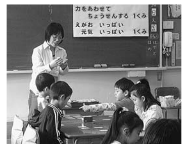
▲地域住民による朝学習