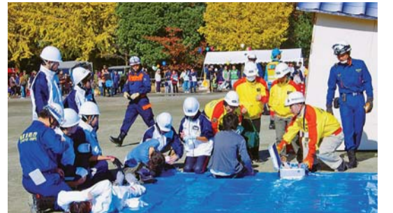
▲中学生レスキュー隊の訓練の様子

都立和田堀公園では、消防署や警察署、自衛隊などの関係機関や地元防災会、中学生レスキュー隊のメンバーなど430名をはじめ一般参加者などおよそ3100名が参加しました。訓練では、体験コーナーをスタンプラリーで回ると「なみすけホイッスル」がもらえる催しや、地域のコミュニティーチャンネルの役割を担う「COM東京」の協力によって、緊急地震速報のデモンストレーションやケーブルテレビでの生中継も行われました。今回が初めての試みとなるテレビ生中継では、自宅で訓練の様子が確認でき、会場に参加できなかった多くの区民の防災意識を高める機会となりました。