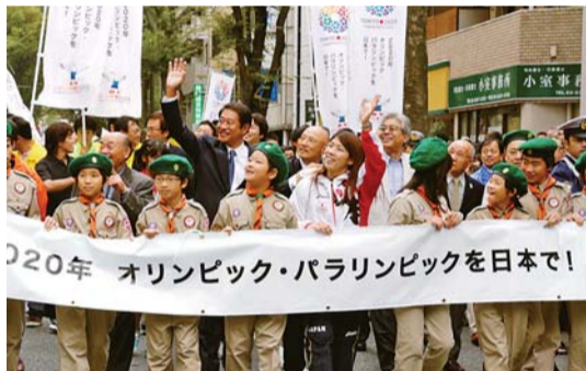
▲区制施行80周年記念&東京オリンピック招致パレード

区制施行80周年を記念するとともに東京オリンピック・パラリンピック招致をPRするパレードに、レスリング女子55キロ級で世界選手権と五輪を合わせて13大会連続世界一を達成し、国民栄誉賞も受賞した吉田沙保里選手が参加しました。