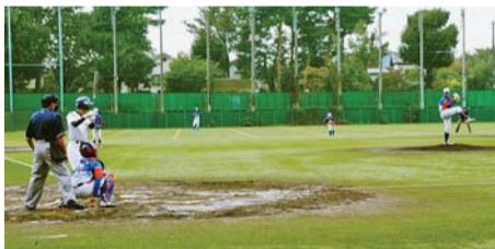
▲中学生親善野球大会(活動例)

次代を担う子どもたちが、交流や自然体験を通して、広く社会に関心を持ちながら将来の夢を思い描き、その夢に向かって成長していけるように、「杉並区次世代育成基金」を創設しました。区民の皆さんからのご寄附も受け付けています。