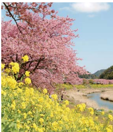
▲南伊豆町 みなみのさくらと菜の花まつり

区の交流自治体である静岡県南伊豆町は、温暖な気候に恵まれており、東京より一足早いさくらと菜の花で有名です。このたび、新宿から下田までの直通電車「リゾート踊り子号」が運行されるのを記念し、河津の桜と温泉の旅を企画しました。