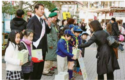
▲西荻窪駅での駅頭募金活動

福島県南相馬市へのさらなる復興支援のため、式典、駅頭募金を実施しました。3月31日までに寄せられた義援金(2億1327万1375円)は、南相馬市へ届けられ、次世代の育成や地域コミュニティーの再生・活性化など、市民が将来に夢や希望を抱くことができる事業に充てるため、「南相馬市みらい夢基金」として活用されています。