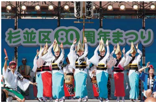
▲杉並区80周年まつり 東京高円寺阿波おどり

区制施行80周年を記念して、10月13日(土)・14日(日)に桃井原っぱ公園で、「杉並区80周年まつり」を開催しました。福島県南相馬市立石神第一小学校の児童らが作詞した復興支援ソング「福島から伝えたい」を歌い、また交流自治体である北海道名寄市、群馬県東吾妻町、新潟県小千谷市、福島県北塩原村・南相馬市、東京都青梅市、静岡県南伊豆町の物産展など、テントが約110張並びました。