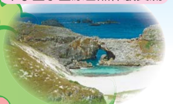
中学生小笠原自然体験交流