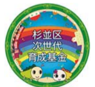
▲ステッカーイメージ

※今後、区施設等に基金への募金箱の設置を行う予定です。設置時期など詳細が決まり次第、「広報すぎなみ」や区ホームページなどでお知らせします。