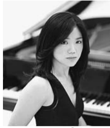
河村尚子