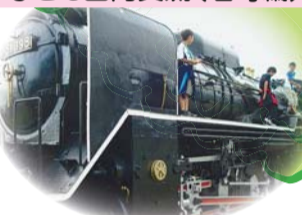
子ども国内交流(名寄編)