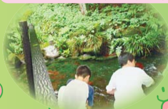
子ども国内交流(東吾妻編)