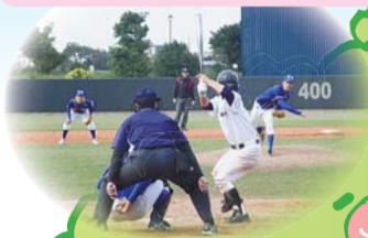
交流自治体中学生親善野球大会