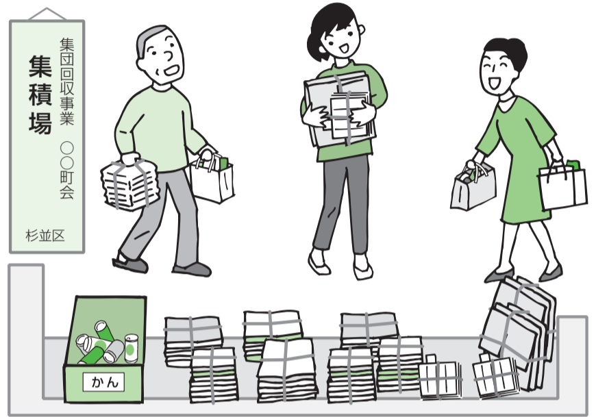
▲ご近所の皆さんで集団回収を始めませんか