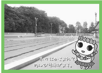
ホワイにかき泳ぐのがおすすめです。

京王井の頭線西永福駅から徒歩8分、大宮2丁目にある和田堀公園プールもその一つ。50mと25mプールのほか、幼児用プールもあるので、家族みんなで楽しめます。たっぷり泳いだあとは、和田堀公園を散歩してみても。善福寺川沿いを歩いて和田堀池まで行けば、近くに釣り堀「武蔵野園」があります。創業50年ならではのレトロな雰囲気の売店でアイスを買って、涼やかな水面に釣り糸を垂らせば、晩夏の風情が満喫できるのではないでしょうか。