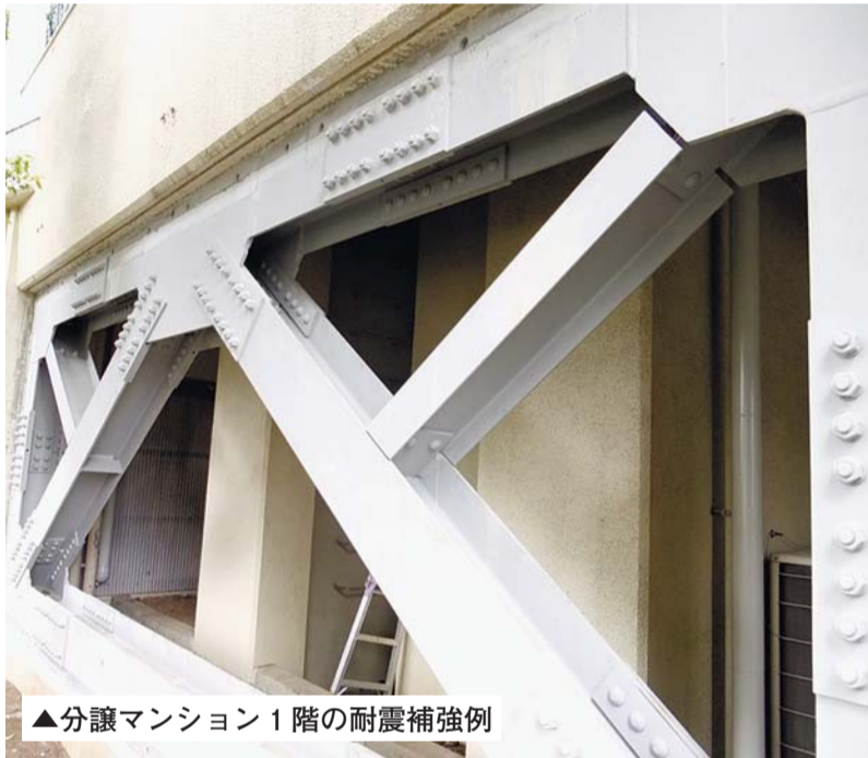
▲分譲マンション1階の耐震補強例