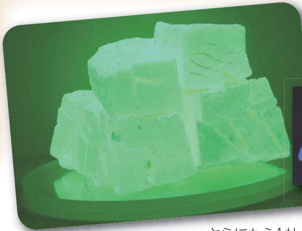
ネモトのルミノーバ・N夜光各種