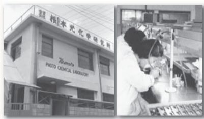
根本特殊化学工場および工場内(1963年当時) 1962年、根本特殊化学株式会社に改組。

後に大河原記念技術賞を受賞。各国でも特許を取得し、この技術において世界をリードする企業へと成長した。根本郁芳会長いわく「開発から約20年、ネモトの技術を超える製品はいまだに現れない」そうだ。