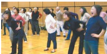
▲ラフターヨガ (笑いとヨガの呼吸を組み合わせた運動)

健康づくりリーダーとは、区民の健康づくりを応援するボランティアです。「健康笑顔の仲間づくり」を合言葉に講演会や講座などを保健所・保健センターと協働して企画、実施しています。簡単に楽しく役立つ催しですので、区民の皆さんの参加をお待ちしています。