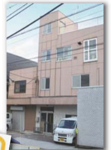
八欧産業・本社 1979年、南荻窪に本社を竣工。その後、規模を拡大しながら業界内の地位を確立している。

前回のペンシルロケットに続き、ここにも宇宙への夢を実現する技術があったのだ。そして、時代はデジタルへ。次回は、杉並が誇る都市型産業を特集する。(区民ライター 関)