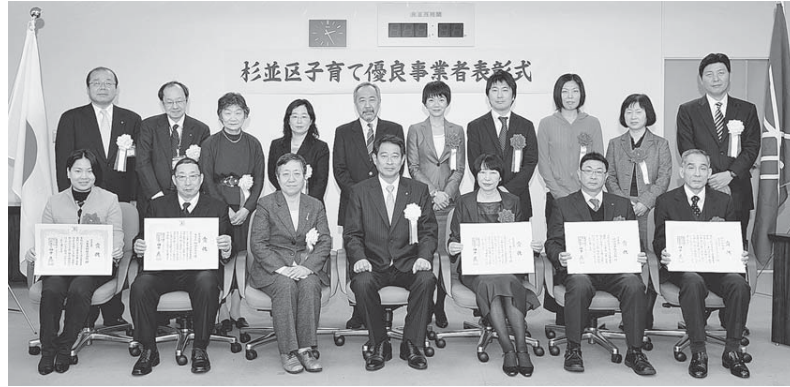
▲1月26日(木)に、区長から受賞者の皆さんへ表彰状が贈られました。おめでとうございます。