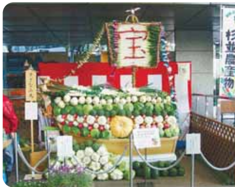
▲農業祭のシンボル 野菜で形づくられた宝船