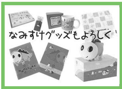
なみすけグッズもよろしく! ウェブサイトもあつちよ!

えば、なみすけ(ブログ更新中!)。本天沼の洋菓子店には「なみすけ・ナミークッキー」があります。「手頃な値段で日持ちするなみすけのお土産を作りたかった」というなみすけ好きの店主が考案。絵柄