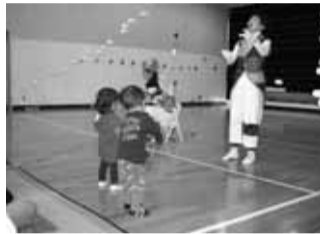
▲ストリンググラフィコンサートの様子

お子さんとママがお互いに「なでなでマッサージ」、ママがプロと不思議楽器演奏、ママも子供も一緒に床いっぱいお絵描き…。乳幼児とお母さんが一緒に楽しめる「0歳からの芸術体験プログラム」は、子育て経験のあるスタッフがサポートして、お母さんに創造性を発揮していただく機会も作っています。普段当該児童館を利用することのない地区からも参加がありました。芸術体験を活かしたママと乳幼児の笑顔あふれる「子育て支援」アートプログラムとして児童館で継続的な活動を目指したいと思います。