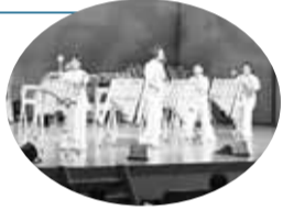
▲竹楽器コンサート

NPO支援基金は寄附を財源にして、NPO活動を資金面から支援しています。昨年もNPO支援基金の普及啓発とNPO活動への理解促進を目的として、「すぎなみNPOフェスタ」を開催し、基金チャリティー公演（右写真）や展示室でのワークショップのほか、企業からの協賛品の提供もあり、総額約47万円にのぼる寄附が集まりました。