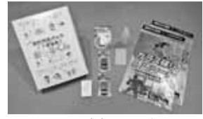
▲3月8日(火)から区役所1階ロビーのショップで1箱500円で販売します

警報アラームや補助錠などの詰め合わせた区オリジナルの防犯用品パック「すぎなみまもるくん」(右写真)の作製を記念し、区や地域の皆さんのさまざまな防犯活動を写真やチラシで紹介します。また、区が作製した防犯啓発物品も展示します。 時 3月8日(火)～10日(木)午前8時30分～午後5時 場 区役所1階ロビー 申 込 当日、直接会場へ 問 危機管理対策課