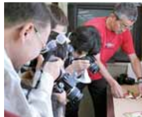
▲区民ライター講座