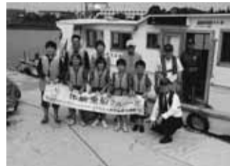
▲環境学習と体験航海をした皆さん

東京湾を海難救助艇に乗って港湾施設を見学し、子供たちが中心になって東京湾の2カ所で海面から透明度の測定、プランクトンの採取・検鏡など水辺環境について学習しました。この体験航海は8月・10月の2回行いました。水温が高く、日差しの強い夏は光合成作用が活発になり、植物プランクトンが増殖して水が赤茶色く濁ったようになり、透明度板も見えにくくなります。また海水のプランクトン量を水の濁りに置き換えて濁度計で測定しました。