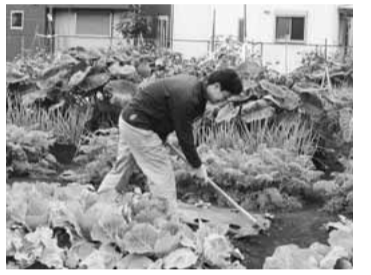
▲園主の指導があるので、初心者でも安心です

(時) 3月中旬～23年1月31日(契約の更新は園主との相談で、最長4年) (場) フォーム