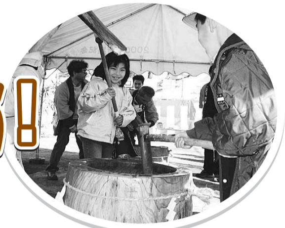
▲もちつきは、毎年地域の方とのふれあいの場となっています

児童館は区内に41カ所あり、0～18歳の子どもたちがいつでも誰でも気軽に利用できる身近な居場所です。遊びや自主的な活動を通して、子どもたちが心身ともに健やかに成長できるよう支援しています。また、子育て中の保護者の出会い・情報交換の場となるように、さらには地域の子どもたちを見守る大人の活動の場となるような運営も行っています。