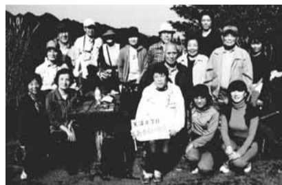
▲昨年は神奈川県の大山に登山にでかけました