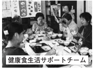
健康食生活サポートチーム

また、外出の少ない人たちの社会参加を促し、共に楽しく食事をする中で、お互いの交流と親睦を図る場ともなっています。