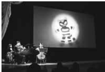
▲音楽影絵劇「100万回生きたねこ」(「すぎなみNPOフェスタ」より)

昨年もNPO支援基金の普及啓発とNPO活動への理解促進を目的として、「すぎなみNPOフェスタ」をセッション杉並で11月14日に開催しました。基金チャリティー公演や展示室でのワークショップのほか、企業からの協賛品の提供もあり、総額約26万円にのぼる寄附が集まりました。多数のご来場とご寄附をありがとうございました。