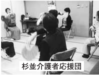
杉並介護者応援団

支援基金の助成により、住まいの近くで気軽に参加できるよう、浜田山地区に加え、荻窪地域にもミニデイサロンを増設し、支援のネットワークづくりを目指しています。