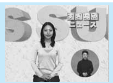
▲区の情報満載です

貸し出し用のDVD・VHSテープも用意していますので、電話連絡の上、広報課(区役所東棟5階)へお越しください。