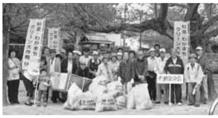
▲10月17日「科学と自然の散歩みち」で行われたクリーン大作戦

中瀬自治会は杉並区の北部に位置し、西武新宿線の下井草駅と井荻駅の中間南側、早稲田通りをまたいで清水三丁目、妙正寺池までが自治会の範囲です。自治会内はまったくの住宅地で、中瀬保育園・桃井第五小学校・中瀬中学校・井草区民事務所・妙正寺体育館などの公共施設と天祖神社・稲荷神社・三峯神社などがあります。