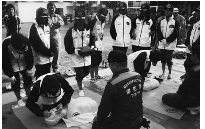
▶総合震災訓練(中学生レスキュー隊)の様子