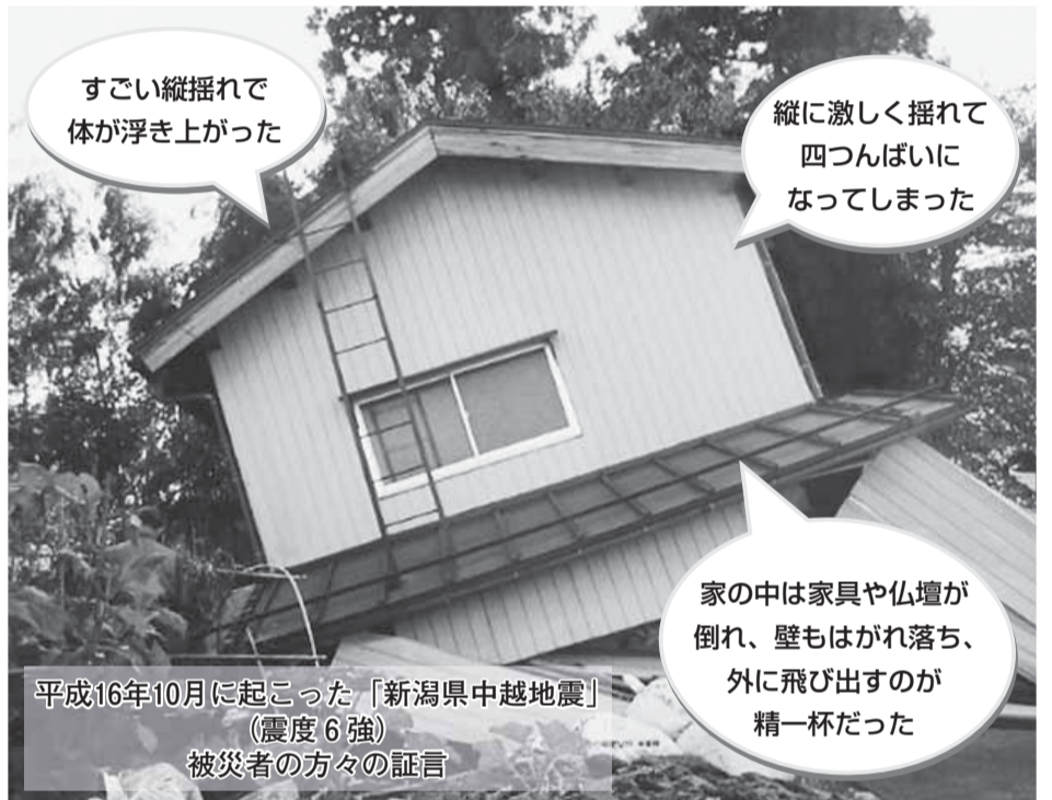
平成16年10月に起こった「新潟県中越地震」(震度6強) 被災者の方々の証言

大地震が来た瞬間、皆さんの正しい行動が被害を最小限に食い止めます。日ごろから「自らの安全は自ら守る」ことを心がけましょう。 ——問い合わせは、防災課へ。