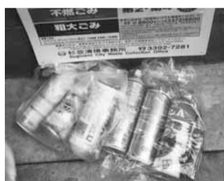
安全な出し方にご協力をお願いします

また、プラスチック製容器包装を焼却しないことによるCO 2 発生抑制量は約一万三〇〇〇tと、環境負荷低減に役立っています。