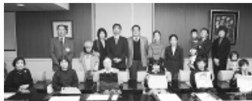
▲入賞者の皆さんおめでとうございます

10月18日(土)・19日(日)の「環境博覧会すぎなみ2008」で、マイバッグコンテストを行いました。今回は、小中学生の部28点・一般の部12点の作品が集まり、投票の結果6名が入賞し、表彰されました。たくさんのご応募・ご投票ありがとうございました。