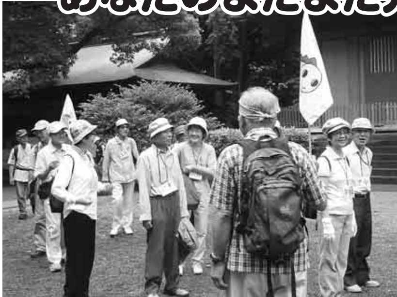
▲歩くことが楽しくなる講座です(続けたいひとのウォーキング講座)