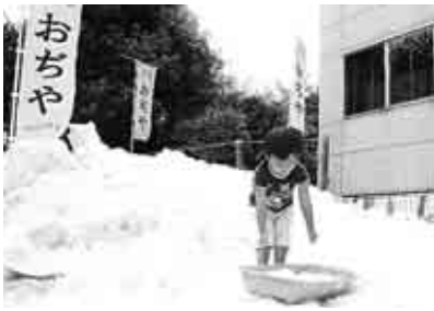
▲真夏の雪に子どもたちも大喜びでした。地域の皆さんに耳を傾けながら、何が最も嬉しいのか

今年の夏も信じられない暑さが続いています。梅雨明け前に真夏日を何日も記録するほどで、温暖化というより酷暑化です。今、私たちにできることがあれば何でも取り組んで、将来のために大きな種を育てなければならぬ時期に来ているように感じます。 そんな暑さ厳しい真夏に行われた永福和泉地域区民センターまつりに、なんと真正銘の雪が登場しました。 この雪は、区が災害時相互援助協定を結んでいる新潟県小千谷市から運ばれたものです。小千谷市は、16年10月の大雪で大きな被害を受けました。その時の区からの支援への感謝として、冬の間に降った雪を貯蔵し、遠路はるばる届けてくださいました。 突然出現した真夏の雪に、子どもたちは大喜びでした。また、来場者に一瞬の冷気を与えようと、小千谷市の皆さんのあたたかい気持ちが伝わってきました。これを機会に地域の輪、小千谷市との交流が、 さらに広がることを期待しています。 タイトルの「元氣と文化が生まれる広場」は、私たちがこの二年間掲げているテーマです。 区は、「歩きながら、元氣と文化が生まれる街」を標語に掲げていますが、こちらは、少し足を止めてもらって、みんなに地域区民センターなどに集まってもらうというものです。ある時はおまつりや音楽会を、またある時は講演会や講座を開催しています。 三四名の委員が知恵を絞って、地域に役立てるよう努めています。 運営協議会は町会や商店会、PTAなどさまざまな団体から集まった委員が、みんなが安心して楽しく過ごせるよう取り組んでいます。私たちの運営協議会ホームページは、 http://www.w15.ocn.ne.jp/~houana/ で、地域情報を発信中です。ご覧ください。 (総務部長・笠原克信)