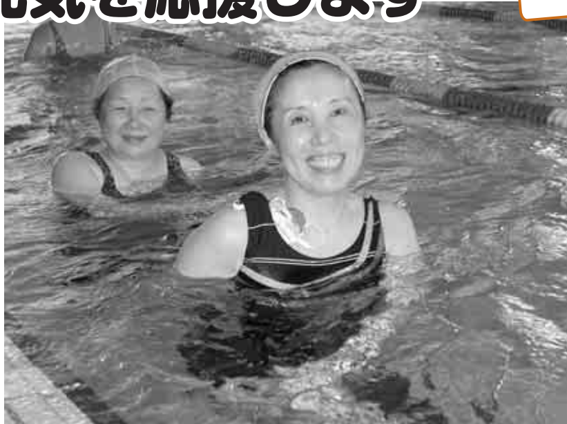
▲仲間との出会いや交流も大切です(水中ゆらゆら歩行)