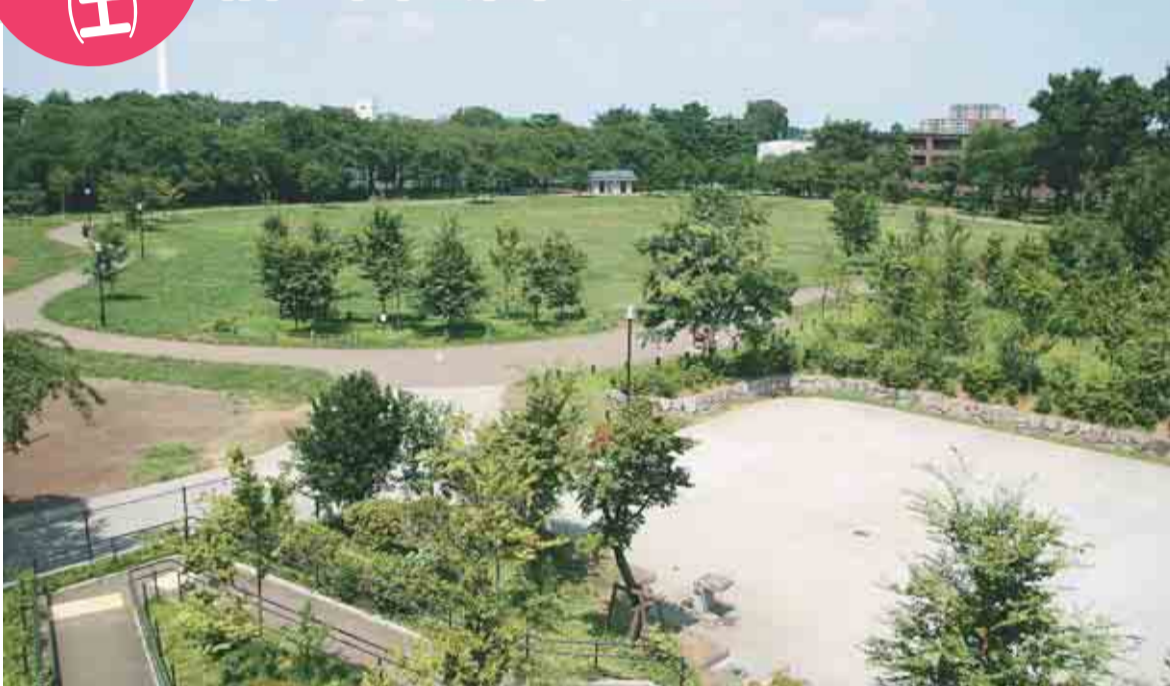
みどり豊かな柏の宮公園 (4・35 ha)

「みどりのイベント2008」は、あそびを通じて、身近にあるみどりに親しみ、みどりと遊び、みどりについて考えてもらうというイベントです。草地広場・疎林広場・池・茶室などがある区内で最も大きな「柏の宮公園」で、みどりと触れ合いませんか? —— 問い合わせは、みどり公園課みどりの計画係へ。