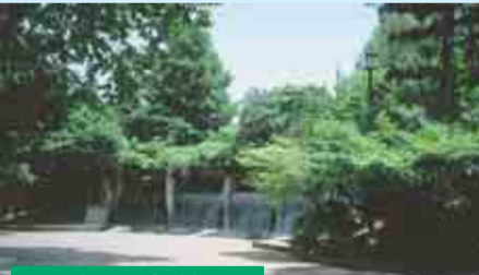
蚕糸の森公園 和田3-55-30