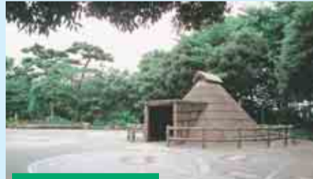
塚山公園 下高井戸5-23-12