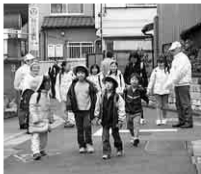
▲朝のあいさつ運動

そこで、私たちの地域では、自主防犯団体のピースプラスワンと協力しながら、あいさつ運動に取り組んできました。朝、地域の中にある新泉小学校と専修大付属高校の子どもの登校時間に、通学路に立って「おはようございま