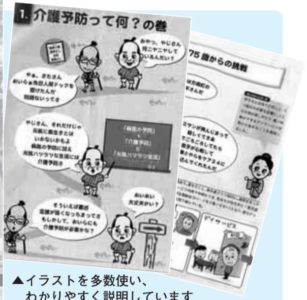
▲イラストを多数使い、わかりやすく説明しています

介護予防とは「要支援・要介護状態をできるだけ防ぐこと、そして要支援・要介護状態であってもその悪化をできるだけ防ぐこと」です。その介護予防についてわかりやすく説明したパンフレット「やじさん・きたさんのころばぬ先の介護予防」を作成しました。 ——問い合わせは、介護予防課介護予防推進係へ。