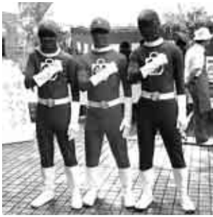
▲杉並戦隊イレンジャー

区内高等学校、大学、団体からなるマイバッグ推進連絡会の参加者と一緒、好きなマイバッグを作ってみませんか。マイバッグ普及を呼びかけるヒーロー「杉並戦隊イレンジャー」も登場する予定です。