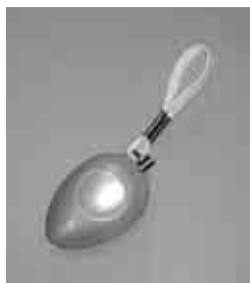
▲お貸しする 防犯ブザー

区内在住で、私立・国立の小 学校などに4月に入学する一年 生に、防犯ブザーを無料でお貸 しします。