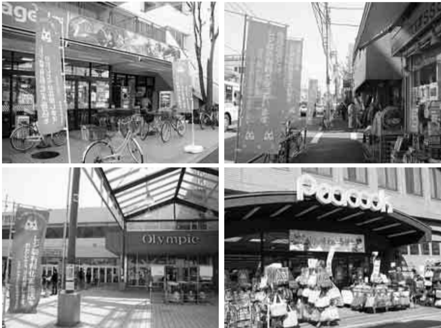
▲レジ袋有料化にご協力いただいている区内スーパーなどのうち、いなげや杉並新高円寺店(左上)、東田町バス通り商店会(右上)、オリンピック高井戸店(左下)、大丸ピーコック久我山店(右下)