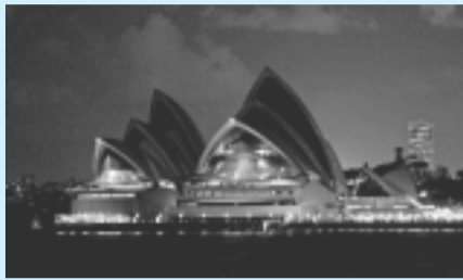
▲昨年実施したシドニー市の様子

アースアワーは、世界自然保護基金(WWF)の支援のもとに実施される、地球温暖化防止を呼びかける世界規模の消灯イベントです。今年シドニー、サンフランシスコ、マニラなど世界20を超える都市が参加し、日本では初めて杉並区が参加します。