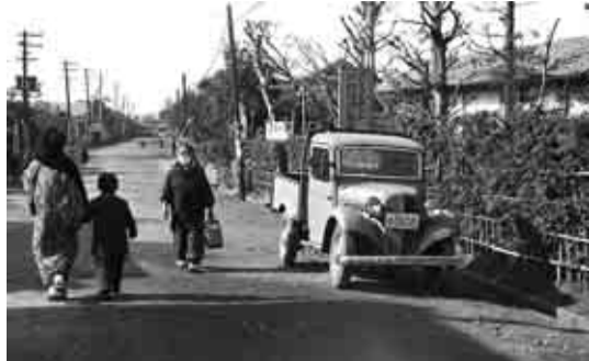
馬橋小学校へ続く道

郷土博物館で19年10月27日から開催し好評をいただいた写真展を、一部構成を変えて巡回展示します。ぜひご覧ください。