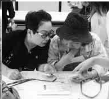
▲携帯電話を持つことが、この教室の特徴です

認知症の予防には、有酸素運動の習慣化と、脳の機能を鍛えることが、効果的だと考えられています。さらに、「楽しく・長く・仲間と」をモットーに認知症予防に効果がある教室を開催します。趣味活動を中心とした初心者向けの教室です。