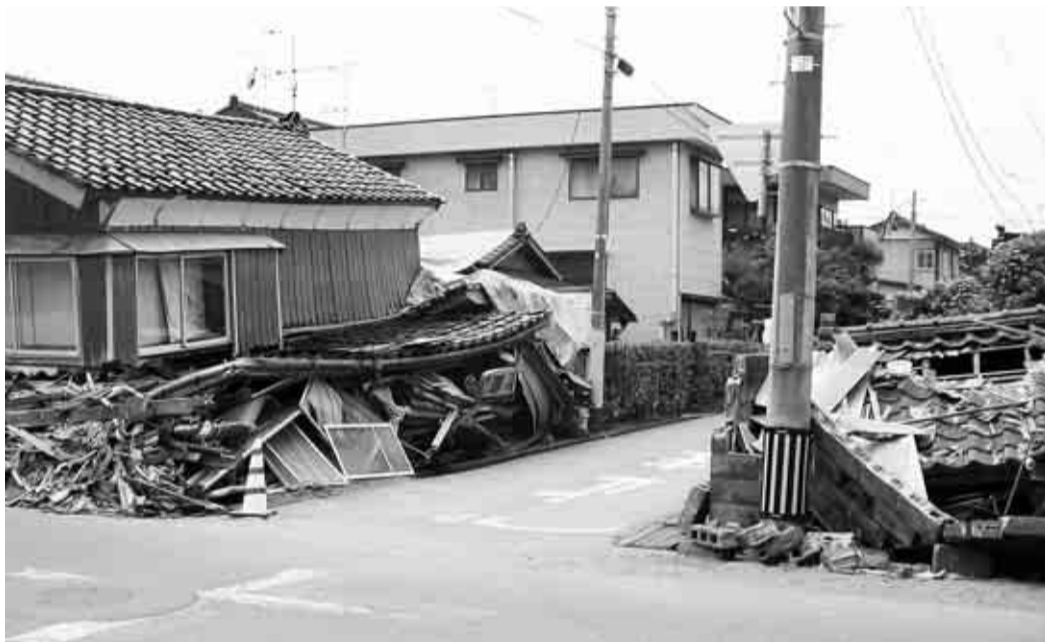
▲7月に起きた新潟県中越沖地震での家屋倒壊。家屋を倒壊させないように、日ごろから備えをしておきましょう

【日時】9月2日(日)午後1時30分～4時 【場所】区立小中学校 【申し込み】当日、直接会場へ