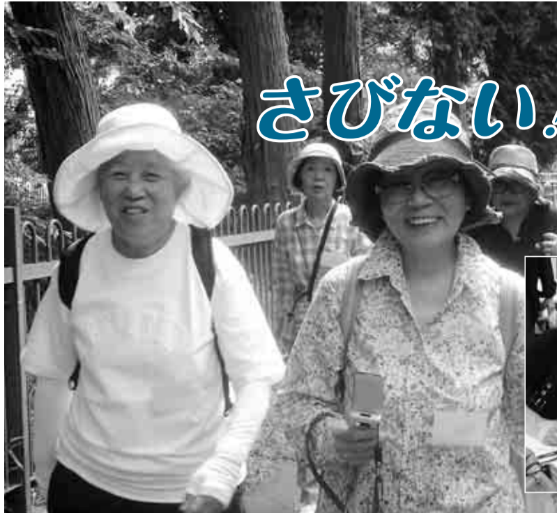
▲好奇心を持って、住み慣れた地域を歩きます(歩く!好奇心教室)