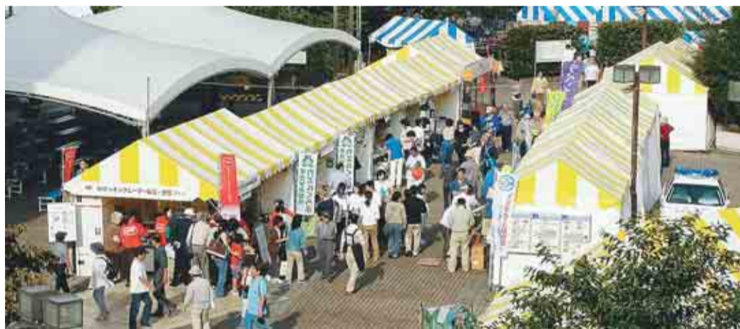
▲ひろば会場(環境博覧会2005より)

【日時】10月14日(土) 午前10時～午後4時 15日(日) 午前10時～午後4時30分 【場所】高井戸地域区民センター (高井戸東3-7-5)