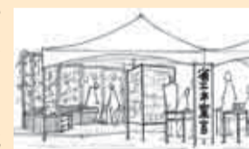
▲省エネ相談ができるエネルギーハウス

これならできる！省エネ作戦を広める発信基地です。まずはここで省エネ宣言をして、エコマネープロジェクトに参加！また、みどりのカーテンで囲まれたカフェでコーヒーなどを飲みながら、省エネ相談も承ります。