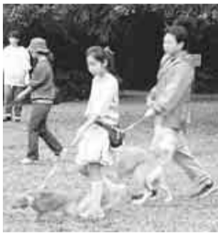
犬のしつけ方教室