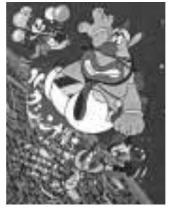
▲ハクション大魔王

◇アニメーター教室「ハクション大魔王」の描き方 プロから直接描き方を学ぶチャンス