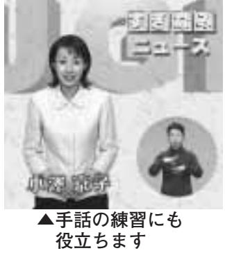
▲手話の練習にも役立ちます

若者の仕事づくりを応援する ビデオ広報「すぎなみニュース」毎週放映中です 区政に関することや、区内の出来事などを中心に、毎週新しい情報をお伝えします。番組