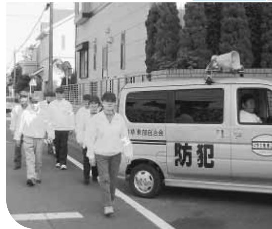
地域の仲間と子育て支援活動