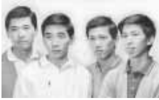
ザ・プロードサイド・フォー

建設現場で働く方のため「中小企業退職金共済法」に基づき国が作った退職金制度です。 事業主は、現場で働く労働者の共済手帳に働いた日数に応じて掛金となる共済証紙をはり、その労働者が建設業界で働くことをやめたときに建設業退職金共済から退職金を払い戻します。 ①国の制度なので安全、確実、申込手続きが簡単です②経営事項審査で加点評価の対象となります③掛金の一部を国が助成します④掛金は事業主負担となりますが、法人は損金、個人では必要経費として扱われ、税法上全額非課税となります⑤事業主が替わっても退職金は企業間を通算して計算されます 掛金 日額三〇〇円(建設業退職金共済事業本部東京支部 ☎3551 5242) http://www.kentai-kyo.tai/syokukin.go.jp/ 都の自動車NOx・PM法買換え特別融資制度など 都では、ディーゼル車対策を促進するために、NOx・PM法の規制対象となるディーゼル車を最新適合車などに買い換える場合、融資をあっせんしています。また、粒子状物質(PM)減少装置の装着補助事業、自動車低公害化促進資金融資も行っています。 時融資事業 18年3月31日まで 補助事業 17年12月28日まで 対都内の中小企業 の事業者の方(都・圏都環境局自動車公害対策部規制課 ☎5388 3535) 融資担当(または ☎5388 3529) (補助担当) 第9コリアンまつり 朝鮮学校と地域住民との親睦を目的としたバザー形式のお祭りです。 時10月23日(日)午前11時〜午後3時(雨天決行) 場東京朝鮮第9初級学校(阿佐谷北1 39 3) ③コリアンフード盛りだくさんのブースをはじめ民族衣装撮影会、雑貨、民芸品コーナーなど(費)無料(当日、直接会場へ) 東京朝鮮第9初級学校 ☎3338 9525 または ☎3338 0097 杉並都税事務所が仮庁舎に一時移転します 庁舎の改修工事に伴い、仮庁舎に一時移転します。 時移転期間 11月7日(月)〜18年3月31日(金) 場〒168 0064 永福1 7 28 (旧都立永福高等学校内) ④杉並都税事務所 ☎3339 31171 (電話番号の変更はありません) 10月は「下水道に油を流さないで!」キャンペーン 都下水道局では、油の排出による下水道管の詰まりや河川・海の水質を守るためのキャンペーンを実施中です。家庭で使った油は①使い切る②吸い取る③ふき取る④固めて捨てるなどして下水道に流さないでください。飲食店は油阻集器を設置してください。 ⑤都下水道局西部第一管 理事務所業務課 ☎3366 6957