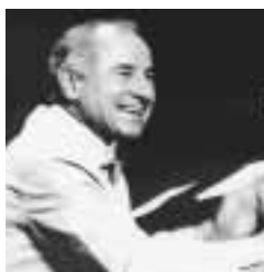
エンリケ・クッティ

哀愁の旋律と情熱のリズムが織り成すアルゼンチンタンゴの世界をご堪能ください。 時8月20日(土)午前10時