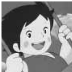
アルプスの少女ハイジ

(原則1人1枚) 往復八ガキの場合は返信用のあて先も記入を あて先は各記事の申込先(住所が記載されていないものは区役所) 託児のある行事は、託児希望の有無、お子さんの氏名・年齢も記入