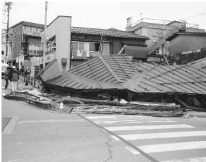
▶新潟県中越地震(小千谷市)の被害

昨年来からの新潟県中越地震、スマトラ沖地震、福岡県西方沖地震など大きな地震が発生し、肝を冷やしました。また、7月23日(土)には区でも震度4の地震がありました。東京でも南関東直下型地震の切迫性が指摘されている今日、大地震への備えは欠かせません。問い合わせは、防災課へ。