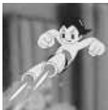
鉄腕アトム 手塚プロダクション・虫プロダクション

時・内①資料展示・切り絵アニメ制作ワークショップ 体験など 9月6日(火)～10月30日(日)午前10時～午後6時②「手塚治虫を語る」トークショー 9月11日(日)午前10時30分～正午(株)手塚プロダクション・虫プロダクション 時9月11日(日)正午～午後4時(小雨決行・区後援)場蚕糸の森公園(和田) 355 30(内出演)歌手・庄野真代ほか(費無料)当日、直接会場へ問セブテンパーコンサートJ.P.杉並支部(株)エストウエス内(倉崎) 3379 4162 http://www.sepcon.jp