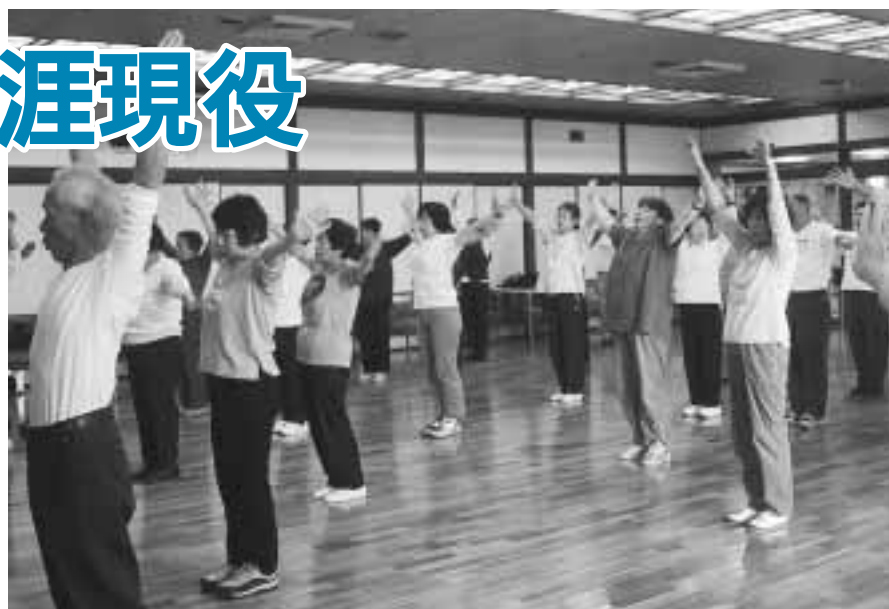
健康エアロビック(高齢者活動支援センター)

9月1日(木)～4日(日)午前の部 10時～正午、午後の部 2時～4時(場)セシオン杉並(梅里1 22 32) 区内在住で、昭和5年9月19日以前に生まれた方(対象者には8月4日に招待ハガキを発送しました) 無料(招待日に、直接会場へ都合が悪い場合は、