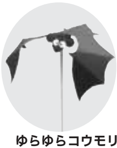
ゆらゆらコウモリ

〜六年生とその保護者(定三 〇名)五〇円(保険料)申・ ☎電話で、6月23日までに 環境課環境都市推進担当へ (先着順)