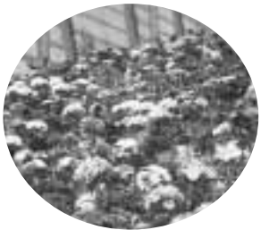
スロープには花がいっぱい!