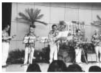
ロイヤルハワイアンズ

●下高井戸区民集会所 貝パールとスワロフスキーで作るアクセサリー おしゃれな色つき貝パールとスワロフスキーを使うておそろいのイヤリング・ネックレス・指輪の三点を作ります。初心者でも簡単です。 7月14日(木)・21日(木)午後1時30分～3時30分(藤枝智子)区内在住・在勤・在学の方(定員20名)費二六〇〇円(材料費を含む)(因)往復八ガキ(3面記入例参照)に希望の色(白・ピンク・パールのうち一色)も書いて、6月27日(必着)までに荻窪地域区民センターへ(他)ハサミ、ハンカチ(ピグが動かない様に敷物として利用)あれば手芸用のペンチをお持ちください