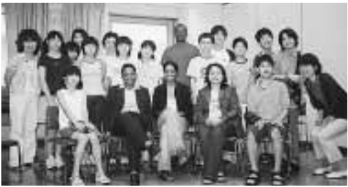
ユネスコ中学生クラブ

く)の午後2時30分~3時25分 ユネスコ理解、英会話、3時35分~4時30分 ゲストによる日本・国際文化の理解、レクリエーションなど(場)セシオン杉並(梅里1 22) 32)ほか(区区内在住)在学の新中学一~三年生(定)六〇名(抽選) 費四〇〇〇円(年間)