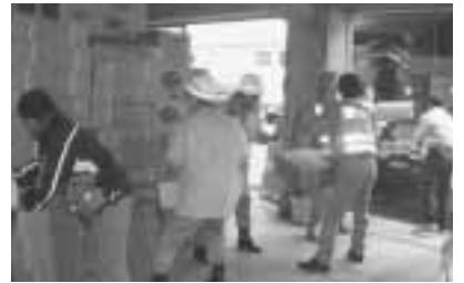
救援物資の搬入の様子