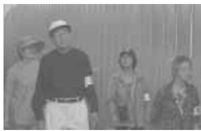
力を合わせて、安全なまちに

成田地区の三町会は、7月に「西田防犯パトロール隊」を結成し、パトロールを行っています。児童館の周りの団地が改築工事のため、児童館を利用する子どもたちをけがや犯罪などから守るのが主な目的です。パトロール隊は総勢四〇名で、各町会ごとに三班に分かれ月曜日から金曜日まで毎日パトロールをしています。メンバーは町会・自治会の方が中心ですが、活動に賛同して参加する方もいます。パトロール時間は夕方から児童館が終わる時間まで、この時間帯以外にはPTAや区の安全パトロール隊、近くの交番の警察官が巡回しています。