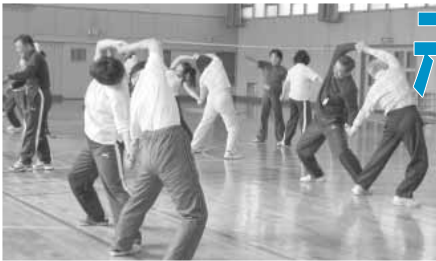
楽しく体を動かしましょう