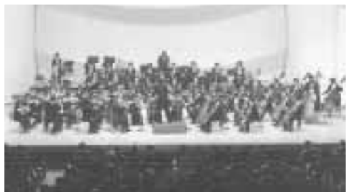
日本フィルハーモニー交響楽団

「日本フィルハーモニー交響楽団」の演奏が繰り出す「カルメン」の世界と日本フィルの華やかな音楽をお楽しみください。