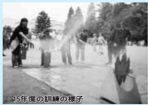
15年度の訓練の様子

●体験してみませんか 大江戸打ち水大作戦 ●体験してみませんか 大江戸打ち水大作戦 ●体験してみませんか 大江戸打ち水大作戦