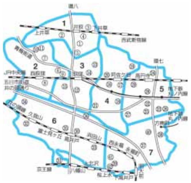
表1 一次抽選の地域別施設一覧