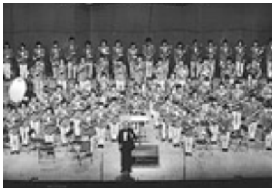
都立杉並高校吹奏楽部