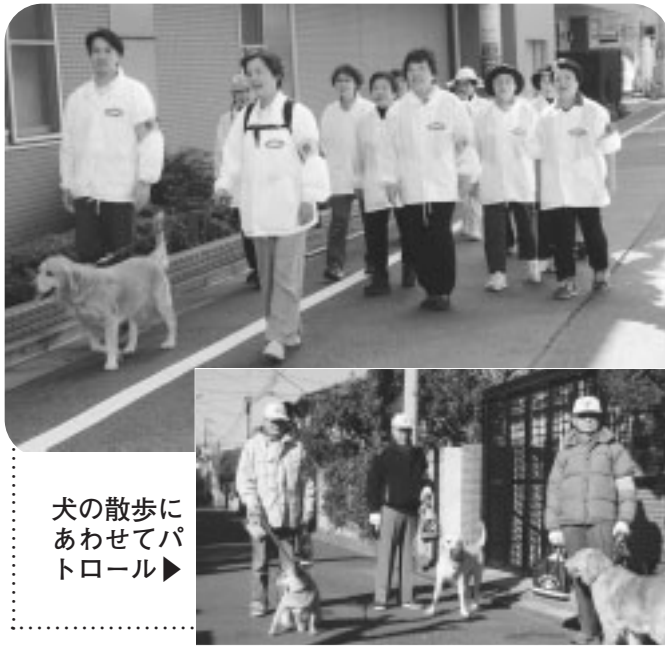
犬の散歩にあわせてパトロール