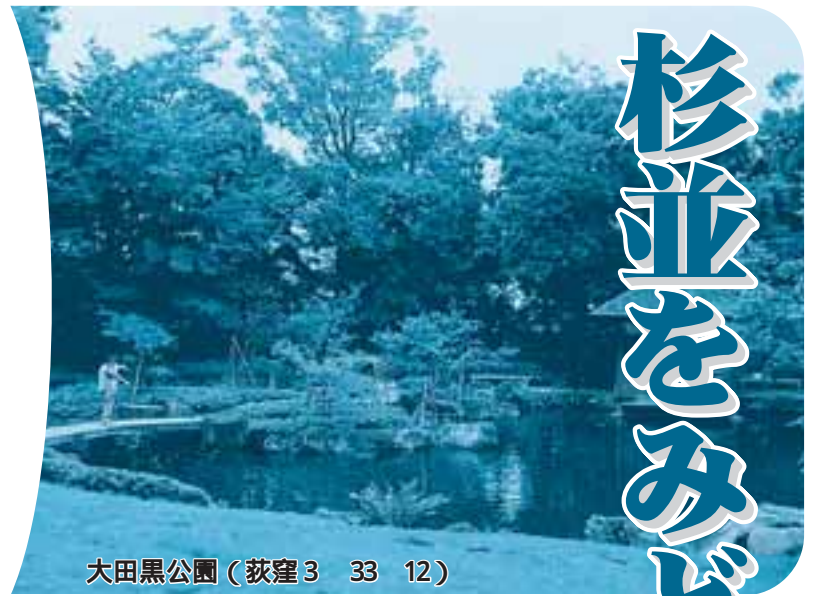
大田黒公園(荻窪3 33 12)