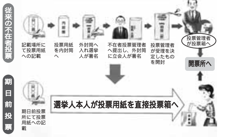
郵便による不在者投票制度