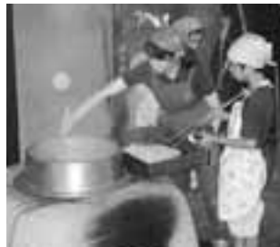
かまどでうどんづくり

月20日(必着)までに郷土 博物館(〒168 0061大 宮1 20 8)へ問同館 3317 0841