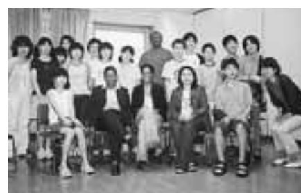
ユネスコ中学生クラブ

界の生活・文化への理解を 深めてもらうことを目的と して、杉並ユネスコ協会が 運営しています。(区共催) 時・4月～17年3月の 毎月第二土曜日(8月を除 く)午後2時30分～3時 25分ユネスコ理解(4 月)英会話 3時35分～4 時30分ゲストによる日 本・国際文化の理解、レク リエーションなど場セシ オン杉並(梅里1 22 32) ほか対区内在住・在学の 中学一～三年生(定員六〇名 (抽選)費四〇〇円(年 間)申往復八ガキ(二面記