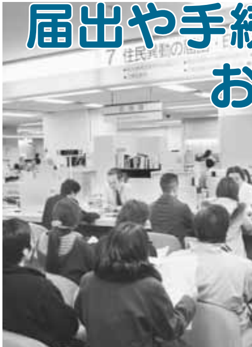
区役所の窓口は混み合います